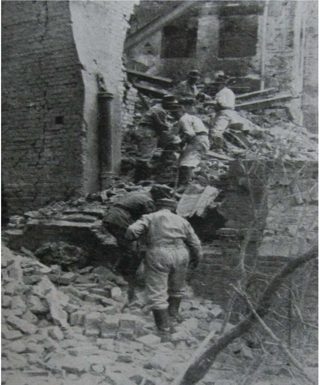
Przygotowania do wysadzenia Zamku Królewskiego. 8 września 1944

Spalone zostały także: Archiwum Kurii Metropolitalnej Warszawskiej, Biblioteka Główna Politechniki Warszawskiej, Kościół oo. Augustianów przy ulicy Pivnej, kościół św.