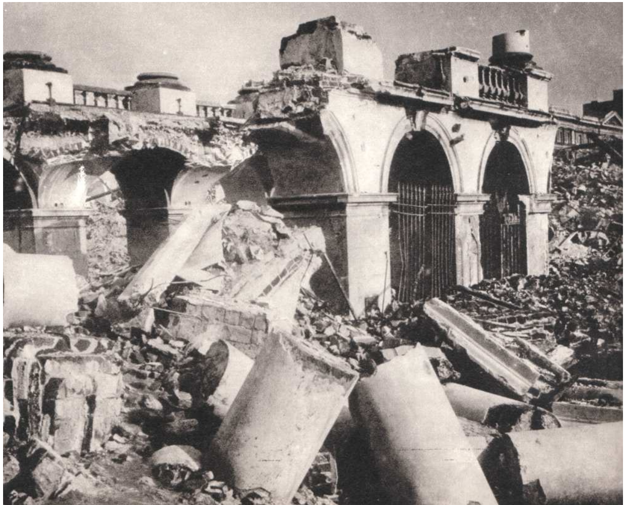
Ruiny Pałacu Saskiego

średnicowego. Zrujnowano lotnisko cywilne na Okęciu, a tabor komunikacji miejskiej (tramwaje i autobusy) zniszczono lub wywieziono do Niemiec. Przy pomocy czołgów wrywano przewody telegraficzne i tory tramwajowe.