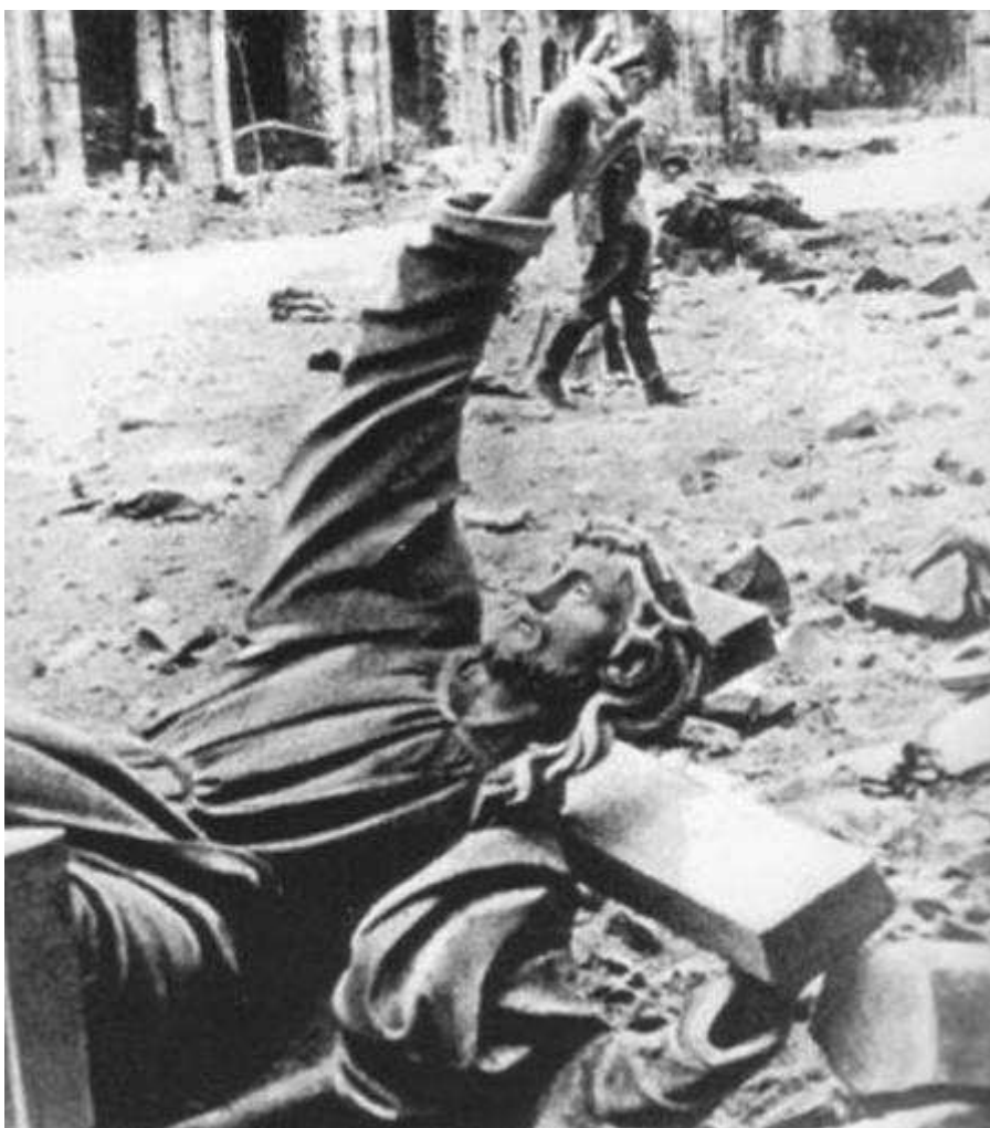
Obalona figura Chrystusa z kościoła Świętego Krzyża (1944)

(podległym teraz bezpośrednio Himmlerowi), który nadzorował działalność sztabów ewakuacyjnych policji i władz cywilnych oraz otrzymał pierwszeństwo przy zagarnianiu pozostawionego w mieście mienia. Siedziba sztabu znajdowała się w Warszawie, u wylotu ulicy Wolskiej. Pod jego nadzorem opuszczone mieszkania bądź budynki publiczne były systematycznie opróżniane z wszelkich wartościowych przedmiotów i materiałów. Wykorzystywano w tym celu m.in. grupę około 800–1000 polskich mężczyzn pogrupowanych w komanda robocze. W skład drużyn roboczych wchodził zarówno robotnicy przymusowi, jak i ochotnicy rekrutujący się z marginesu społecznego zamieszkującego dalekie przedmieścia i strefę podmiejską Warszawy, których zwabiła możliwość wzbogacenia się na szabrowaniu opuszczonego miasta. Część robotników kwaterowała na terenie niemieckiego obozu przejściowego w Pruszkowie. Mieścił się tam również jeden z magazynów rabowanych dóbr. W ograbianiu polskiej stolicy brały także udział służby ministra ds. uzbrojenia, Alberta Speera, oraz aparat podległy gauleiterowi Kraju Warty – Arthurowi Greiserowi.