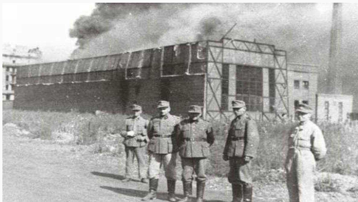
Płonąca fabryka „Ursus” na Woli