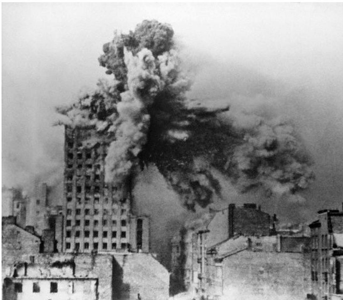
Gmach Prudentialu trafiony pociskiem ciężkiego moździerza. 28 sierpnia 1944

Dwa miesiące zacieklej walk powstańczych przyniosły Warszawie olbrzymie straty materialne. Zniszczeniu uległo wówczas 25% zabudowy lewobrzeżnej Warszawy. Stare Miasto zostało zburzone niemal w 100 procentach (w 1945 tylko jeden budynek, położony przy ulicy Długiej 6, nadawał się do użytku). Bardzo silnie ucierpiały także: Wola, Powiśle, Czerniaków i Śródmieście Północne. Kolejne miejsca na liście strat zajmowały: Śródmieście Południowe, Mokotów, Żoliborz oraz Ochota. Na początku września 1944 Niemcy dokonali również szeregu zniszczeń na terenie prawobrzeżnej Warszawy. Wycofując się z Pragi pod naciskiem Armii Czerwonej, wysadzili wszystkie mosty na Wiśle, jak również spalili lub wysadzili praskie dworce kolejowe.