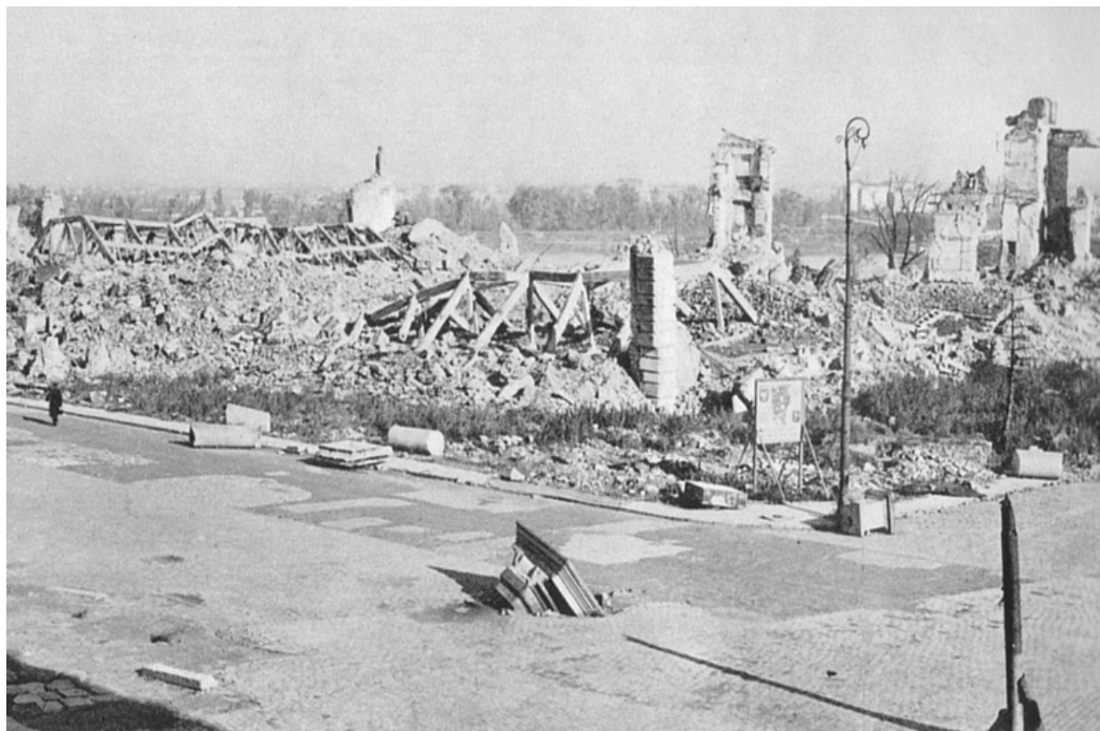
Ruiny Zamku Królewskiego

Aleksandra na placu Trzech Krzyży oraz kościół św. Barbary przy ulicy Nowogrodzkiej. Na skutek częściowego wysadzenia poważnie uszkodzony został Kościół Najświętszego Zbawiciela. Ponadto pod koniec grudnia Niemcy spalili Pałac Łazienkowski, nie zdążyli go jednak wysadzić. Niemal w ostatniej chwili wysadzono natomiast część spalonego w październiku 1944 r. Hotelu Europejskiego. Spośród 31 warszawskich pomników 22 zostały zniszczone. Szereg zabytkowych budynków przygotowano do wysadzenia (m.in. Belweder, Pałac Pod Blachą, ruiny Opery oraz kościoły oo. Bernardynów, Karmelitów i sióstr Wizytek na Krakowskim Przedmieściu), czego Niemcy nie zdążyli jednak wykonać przed nadejściem Armii Czerwonej. Ocalałe budynki zostały jednak zdewastowane i gruntownie ograbione. W przypadku Belwederu w oficjalnym niemieckim meldunku zanotowano, że: „oczyszczenie było tak dokładne, iż ze ścian zostały także zdjęte tapety”.