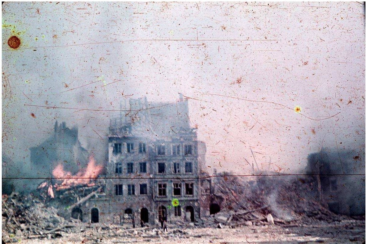
Rynek Starego Miasta w płomieniach powstańczych walk, sierpień 1944

Feldmarszałek Walther Model podczas walk o odblokowanie warszawskich arterii drogowych wydał dowództwu niemieckiej 9. Armii polecenie o następującej treści: Należy całkowicie spalić Warszawę. Rozkazuję podpalić [wszystkie budynki] w promieniu tysiąca metrów na prawo i lewo od ulicy, bo inaczej tamtędy nie przejdziemy (rozmowa telefoniczna w dniu 4 sierpnia 1944).