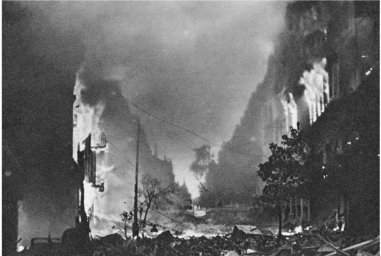
Płonące domy przy ul. Marszałkowskiej

wartości historycznej, kulturalnej lub duchowej. Punkt 10 „Układu o zaprzestaniu działań wojennych w Warszawie” przewidywał: