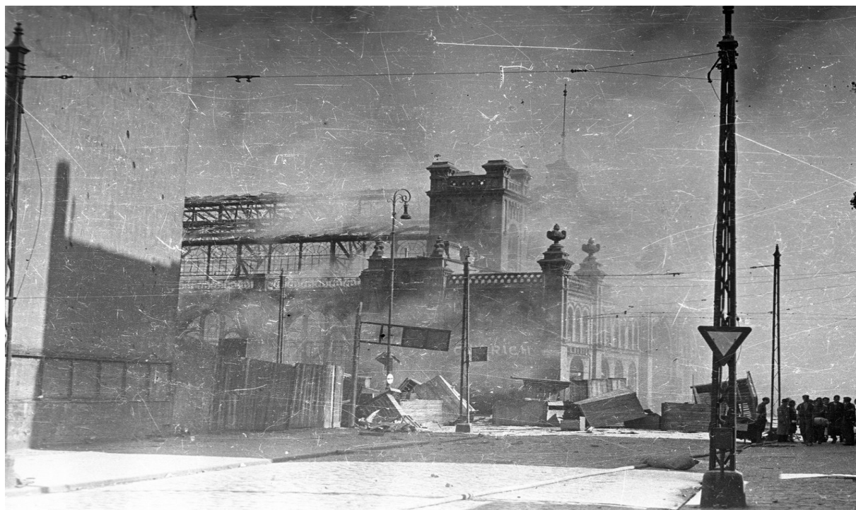
Płonące Hale Mirowskie