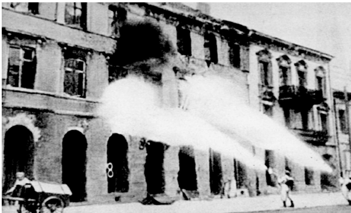
Niemieckie Brandkommando podpalające warszawską kamienicę na ulicy Leszno

Systematycznie podpalali oni dom po domu, kwartał po kwartale. Po upływie dnia lub dwóch sprawdzano skutki i jeżeli pożar wygasł – wzniecano go ponownie. Następnie w ślad za Brandkommando szło tak zwane Sprengkommando , które wysadzało w powietrze wybrane obiekty.