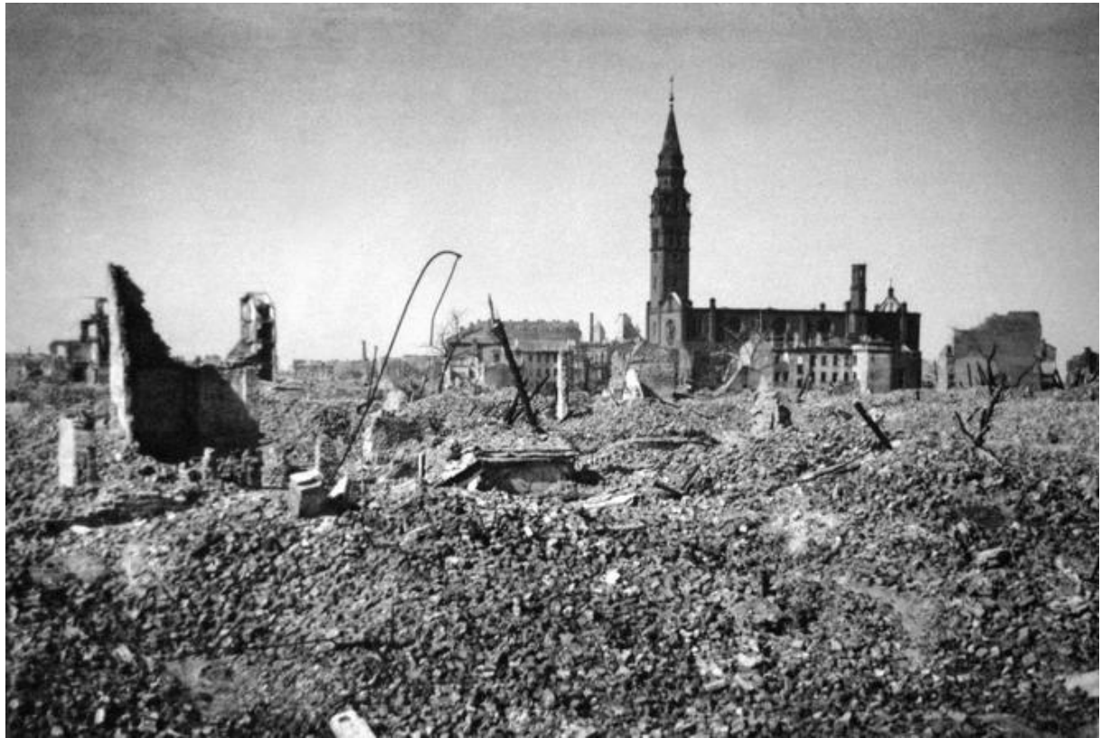
Warszawa zniszczona po Powstaniu Warszawskim

powstania, dowództwo niemieckiej 9. Armii meldowało, że w Warszawie „codziennie załadowuje się 200–300 wagonów celem uratowania tekstyliów, tłuszczów, uszkodzonego sprzętu i silników”. Po zakończeniu powstania nadzór nad akcją rabunku prowadzoną przez służby Wehrmachtu sprawowało dowództwo 9. Armii.